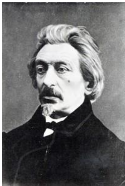
Moses Hess — Bạc tiền bồi đã hướng Karl Marx theo con đường chủ nghĩa cộng sản

Lúc hoàn thành vở Oulanem và những bài thơ ca lúc đầu (trong những bài thơ của Marx có thừa nhận việc ông ta từng ký khế ước với quỷ dữ), ông ta không những không có ý niệm gì về Chủ nghĩa Xã hội mà trái lại còn kịch liệt phản đối. Lúc đó, Marx là Tổng biên tập của Tờ báo tiếng Đức Rheinische Zeitung, tờ báo này còn "tuyệt đối không chấp nhận cho dù trên phương diện lý luận đơn thuần về hình thức của chủ nghĩa xã hội trước đó, nói gì đến mặt thực tiễn của nó? Điều này bất kể thế nào cũng là không có khả năng..."