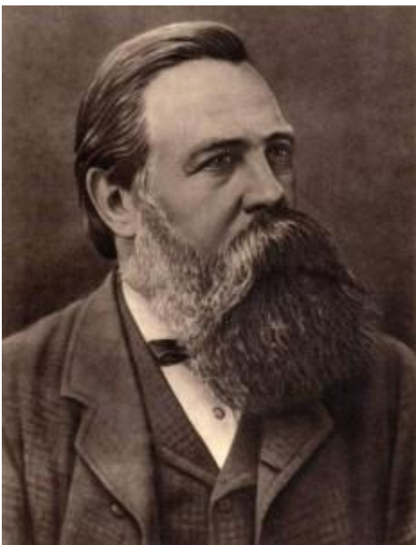
Friedrich Engels — Người bạn đã nuôi Marx suốt nửa đời

Bức thư này được phát hiện một cách ngẫu nhiên trong Thư viện Tài liệu mật. Nó đã chứng thực, Marx là một tên chỉ điểm, trong thời gian lưu vong ở London, ông ta đã cáo giác những đồng chí của mình. Mỗi một tin tức đưa đi, Marx nhận được món tiền 25 bảng Anh. Có rất nhiều những "người cách mạng" ở khắp London, Paris, Thụy Sĩ bị Marx chỉ điểm. Một trong số đó là Ruge, một người từng xem Marx như là bạn thân. Những bức thư qua lại giữa hai người rất thâm thiết cho đến khi Ruge bị chỉ điểm.