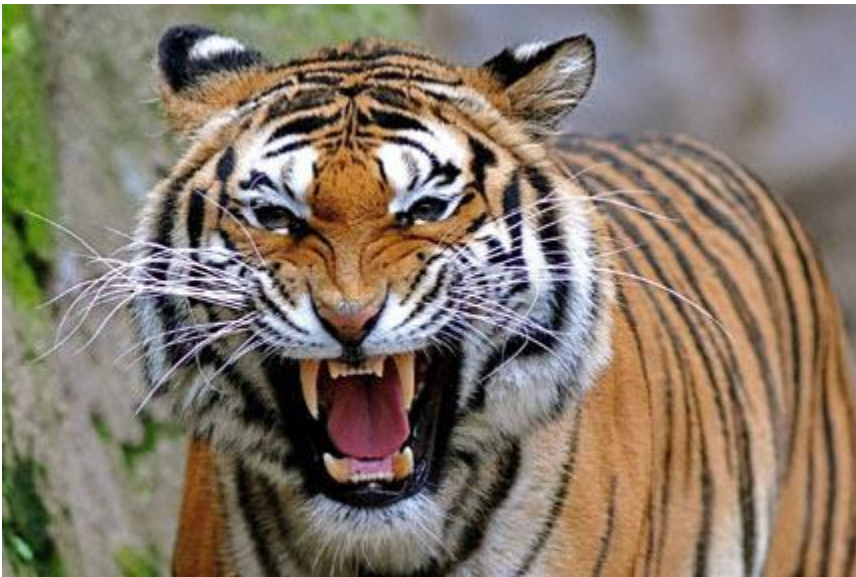
Hình: Cọp dữ nhưng không ăn thịt đồng loại nhưng VC sát hại dân mình

Bỏ nước ra đi: Sau 30-4-75 nếu đất nước Việt Nam thật sự là nơi có tự do và an bình thì người ta không tìm cách ra đi. Trong bài viết với tiêu đề "Cọp Dữ" của tác giả Mục Sư Phan Thanh Bình (San Diego, California, Hoa Kỳ- tác giả của hơn một trăm quyển sách và bài viết sâu sắc) có kể câu truyện: Đức Khổng Tử và các đệ tử của Ngài sang nước Tề, gặp một người đàn bà ngồi ngoài đồng khóc than thảm thiết, vì cha chồng, chồng và con của bà đều lần lượt bị cọp dữ ăn thịt. Khổng Tử hỏi tại sao không bỏ chỗ này mà đi nơi khác, thì bà trả lời: "Tuy vậy nhưng ở đây chính sách của cấp trên không đến nỗi hà khắc như các nơi khác". Mục Sư Phan Thanh Bình đã nhận xét rằng: "Đối với ta, cọp dữ, đáng sợ, nhưng bảo nó ác thì thật không đúng. Cọp có một điểm hơn người là không sát hại đồng loại...". Mục Sư Bình cũng khéo léo nhắc mọi người hình dung lại một bức tranh: "Sau tháng Tư đen năm 1975, hàng triệu người Việt bỏ nước ra đi và hàng triệu người mơ ước bỏ nước ra đi chỉ vì không chịu nổi chính sách hà khắc, khổ hại đang được áp đặt nơi quê hương".