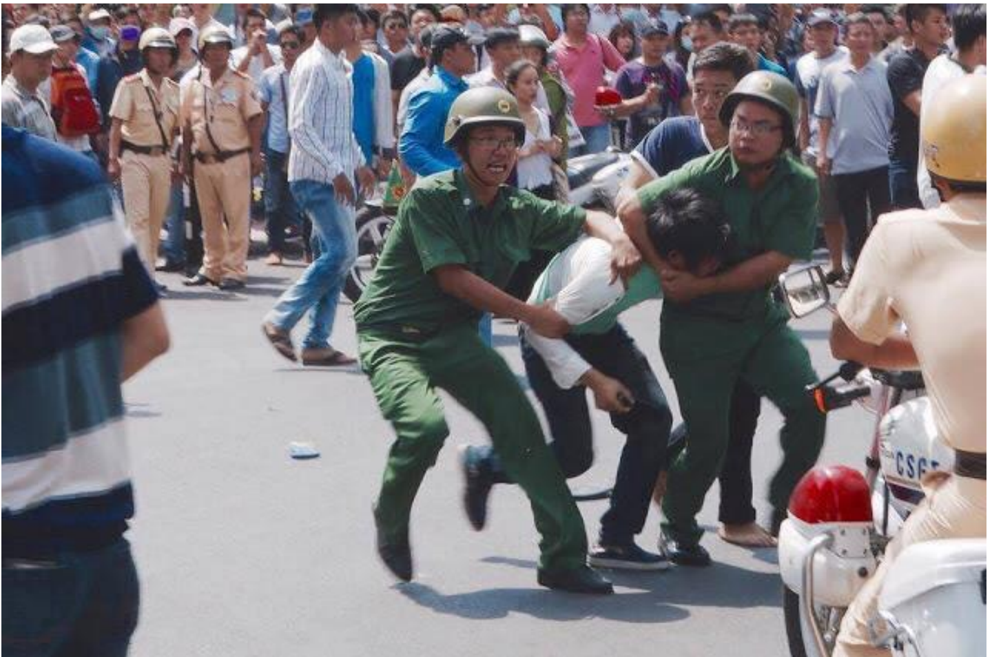
Hình: VC đàn áp người dân yêu nước chống bọn giặc tàu xâm lược

Xin đừng quên: Những ai nhận mình là con dân Chúa đang sống tại các nước tự do trên thế giới, đừng quên những ngày "bỏ của chạy lấy người" trong thời điểm tháng Tư đen 1975, hoặc những năm tháng sống đời mất tự do dưới sự cai trị của VC, hoặc bị giam cầm dài hạn trong các nhà tù khổ sai của chế độ bằng mỹ từ là "trại cải tạo". Đừng quên vì sao dân mình phải lần lượt bỏ nước ra đi. Đừng quên cảnh phụ nữ và trẻ em Việt Nam bị bán ra nước ngoài làm nô lệ tình dục. Dân mình khổ như vậy đó. Xin đừng ai tiếp tục nhân danh tôn giáo, tử thiện, trí thức, lương tâm thầy thuốc, hoặc tuyên bố rằng làm truyền thông nên cần "vào hang cọp để bắt cọp" hầu có dịp ăn nhậu với kẻ thù của dân tộc Việt Nam, hoặc thường xuyên xuyên ra vào Việt Nam làm công việc đánh bóng "nhãn hiệu tự do dân chủ" cho chế độ VC nữa.