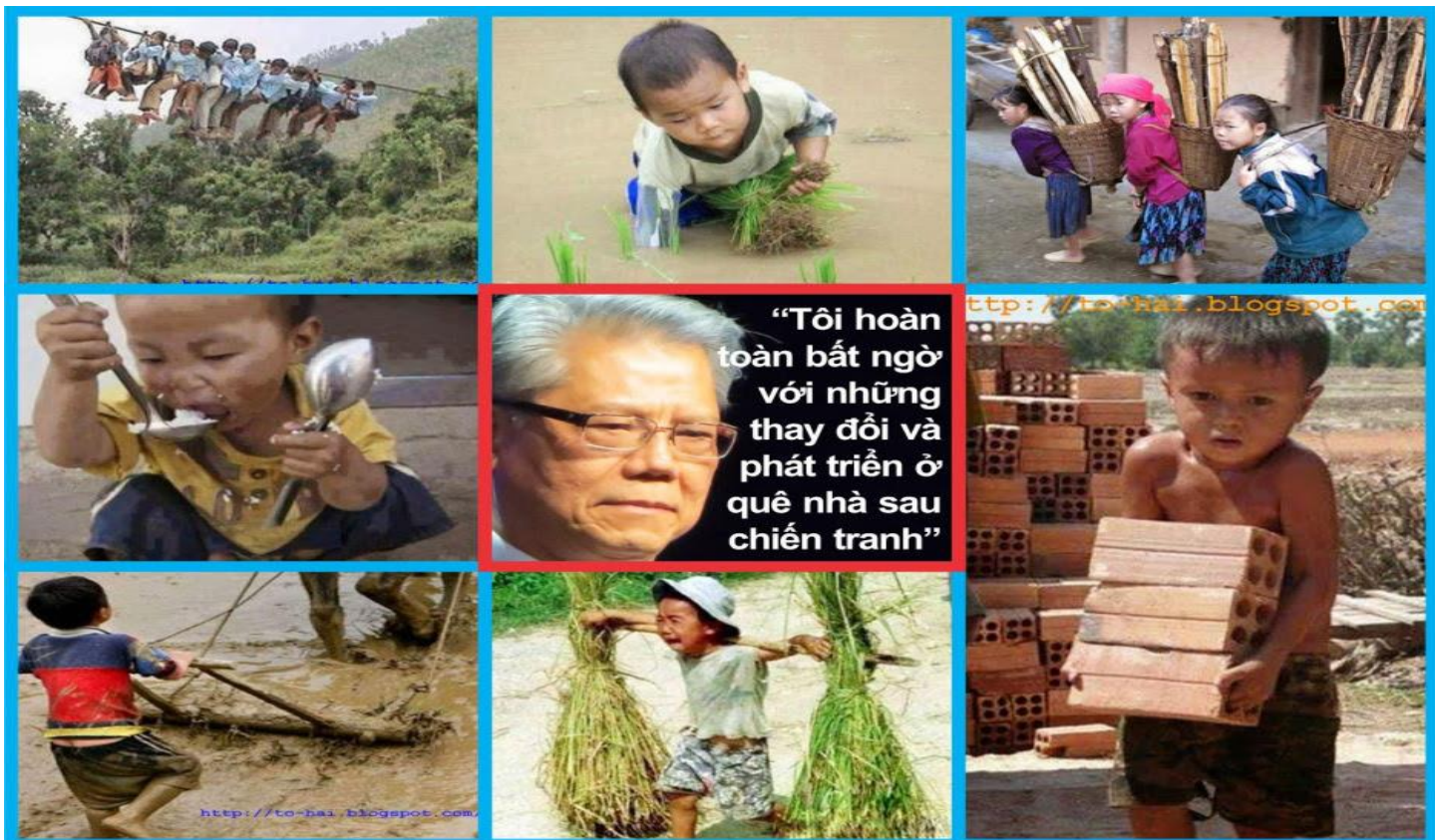
Hình: Hình ảnh người dân đói nghèo và lạc hậu tại VN ngày nay hoàn toàn trái ngược với lời tuyên truyền cho VC của bọn Việt gian rằng "Quê nhà thay đổi và phát triển"-

https://bacaytruc.com/index.php?option=com_content&view=article&id=11870:que-nha-thay-i-va-phat-trin-nh-vy-phi-khong-bac-le-vn-hiu&catid=34:din-an-c-gi&Itemid=53