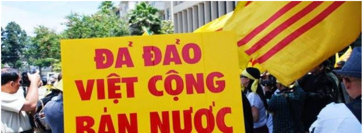
Hình: Biểu tình lên án VC bán nước

Nếu ai thích bài viết này thì xin vui lòng giúp chuyển cho người khác, nhất là giới lãnh đạo các tôn giáo, đặc biệt là Thiên Chúa Giáo. Ai không thích và muốn phản bác thì xin minh danh để tôi có