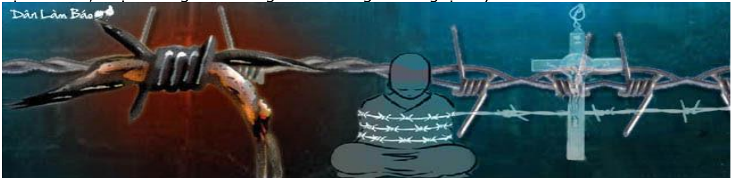
Hình: VC đàn áp tôn giáo tại Việt Nam

Cứ mỗi cuối tháng mười hai hằng năm, là thời điểm báo hiệu cho một năm cũ qua đi và năm mới lại đến. Chúng ta không tiễn thì năm cũ cũng qua, chúng ta không mời thì năm mới cũng đến. Năm mới, Tết đến, dù là "Tết Tây" hay "Tết Ta" mà không có gì thay đổi, lao khổ vẫn hoàn lao khổ, đau yếu vẫn cứ triền miên, tù đày và bạo lực vẫn đổ lên đầu những người cô thế thì đời còn gì vui nữa? Vì thế một người có lòng nhân không thể thiếu sự đau xót, chạnh lòng khi chứng kiến những điều nghịch lý.