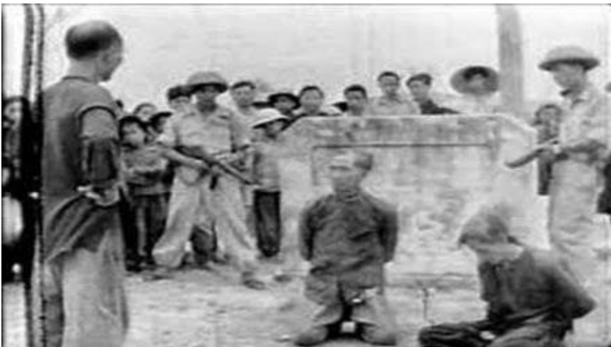
Hình: VC giết người cướp của trong cái gọi là "cải cách ruộng đất năm 1954: Đúng là "Long trời lở đất" hay "Trời không dung đất không tha"?

Giết, giết nữa, bàn tay không phút nghỉ. Cho ruộng đồng lúa tốt, thuế mau xong, Cho Đảng bền lâu, cùng rập bước chung lòng Thờ Mao chủ tịch, thờ Sít ta Lin... bắt diệt