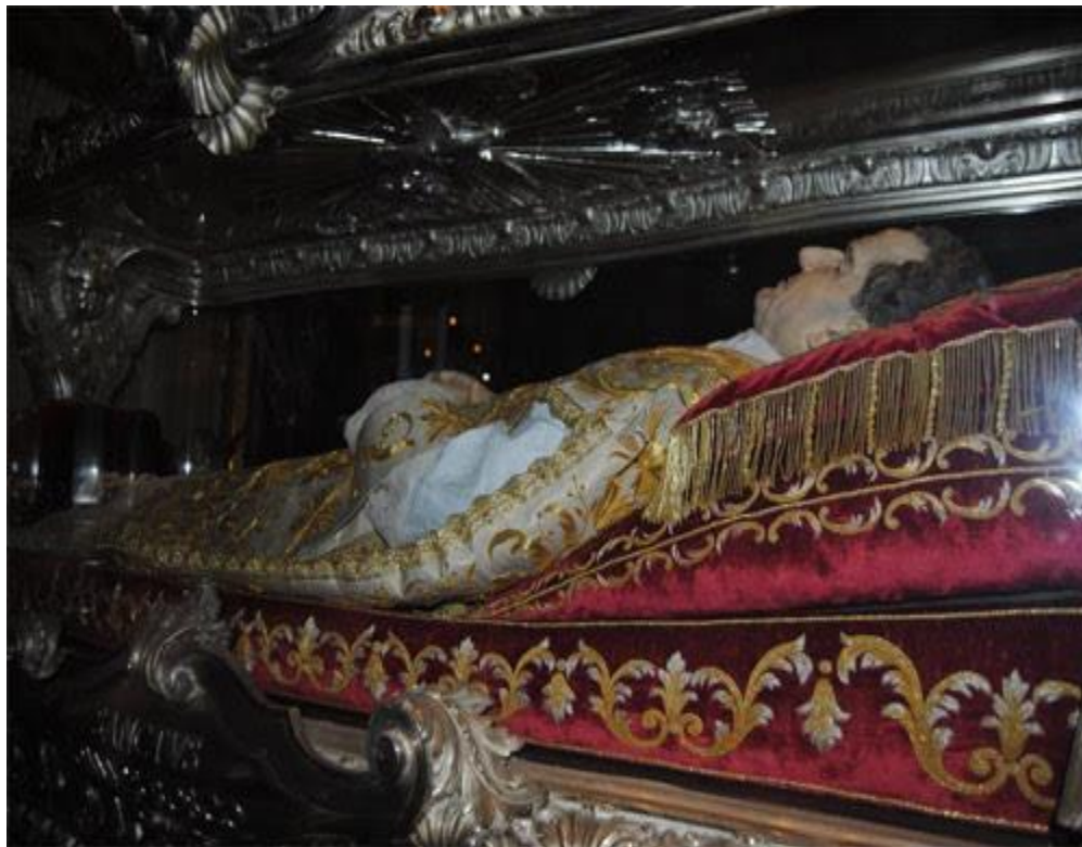
Thánh Johannes Bosco

1837 ở tuổi 68. Bà không phải là một tu sĩ, mà là bà mẹ 7 con nhận được ơn tiên tri của Thiên chúa, thấy được quá khứ và tương lai. Bà sống cuộc đời đạo đức, cố gắng hiến và được Giáo hoàng Benedikt XV phong á thánh vào năm 1920. Mặc dù qua đời khi tuổi đã cao và đến nay đã hơn 175 năm trôi qua, gương mặt vị á thánh này vẫn tròn đầy, căng mịn, rất tươi đẹp.