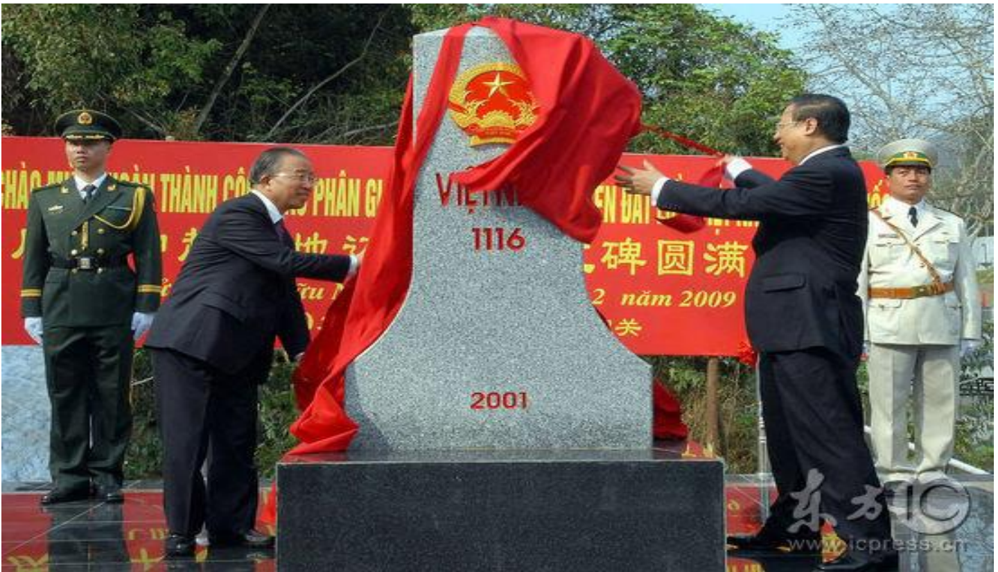
Chụp hình lưu niệm dành cho lịch sử. Con dân nước Việt đừng hòng bén mảng đến chân cửa Ải Nam Quan nữa nhé!